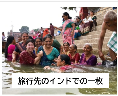
旅行先のインドでの一枚

夢を持って世界で活躍するものよし、日本ではないどこかに長期滞在することで、これまでの生活で気づくことができなかつた喜びや感動、感謝の気持ちや日々沸き起こることがあるかもしれません。海外での暮らしに興味があっても、日本での生活に生きづらさを感じている人、自分と家族が充実した人生を送る為に一番最適な環境を見つけた人は、ぜひ海外へ訪れてみてください。皆さんにとって、きっと新しい発見が待っているでしょう。