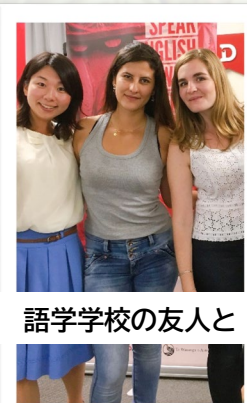
語学学校の友人と

年々条件が厳しくなっていますが、NZは英語を第一言語とする国の中で、永住権が取得しやすい国とされており、世界各国から、人種、宗教、文化が異なる人たちが集い、共生しています。私自身も現在居住権(仮永住権)を取得し、年内に永住権を取得する見込みです。居住権や永住権保持者向けとなりますが、NZでは、ビジネス英語・一般英語・大学などに進学したい人向けの学術英語コース等を語学学校にて無料で学ぶことができます。