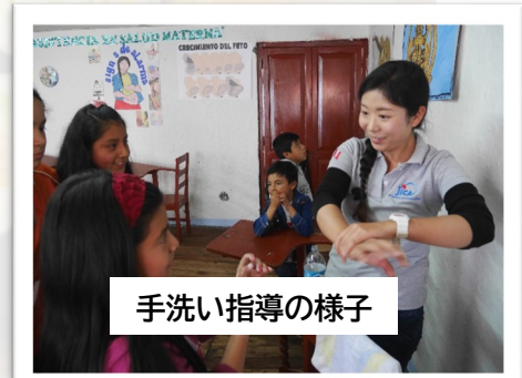
手洗い指導の様子