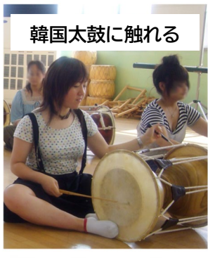
韓国太鼓に触れる

海外に興味をもったきっかけは、大学二年生の頃に参加した、韓国の東国大学校への短期留学です。そこで初めて国際交流の面白さを知り、また、英語がうまく話せず悔しい思いもしました。それまで英語の成績はよくなかったのですが、帰国後は大学で学べる三か国語を必死に勉強した思い出があります(笑)