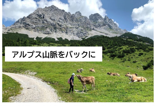
アルプス山脈をバックに

私は高校生まで外国に行くことを全く考えていませんでしたが、大学の時に考えを持ち、十年経ってこうしてドイツで働いています。「私にはできない」「では全く自分を信じたら本当にできる」と思っています。応援しています。