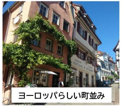
ヨーロッパらしい町並み